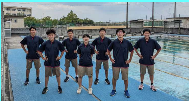
新しいチームウェア 今年のメンバー