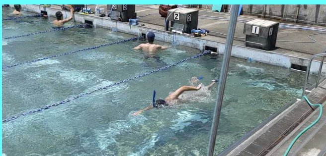
シュノーケルとトライタンフィン 良いフォーム作り